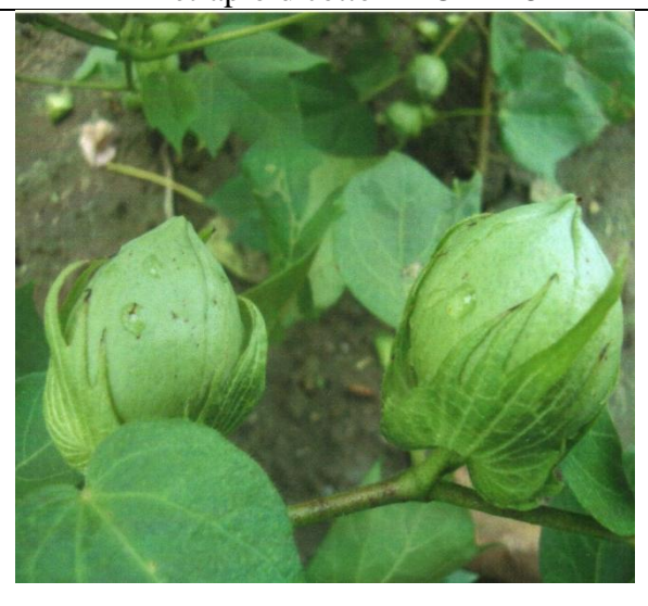
चित्र 06 : बोलः आकार (लंबवत् अनुभाग)ः गो Figure 06: Boll: Shape (longitudinal section): Round