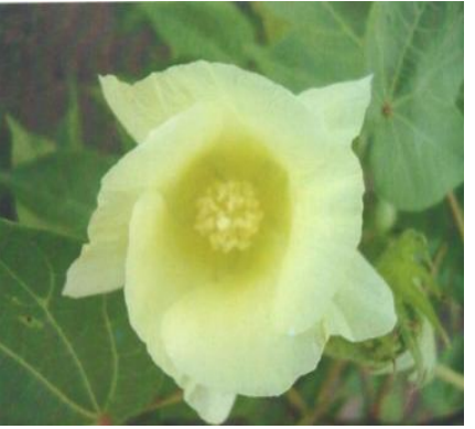
<sub>चित्र 07</sub> : फूलः पत्ती का रंगः पीला Figure 07: Flower: Petal Colour: Yellow