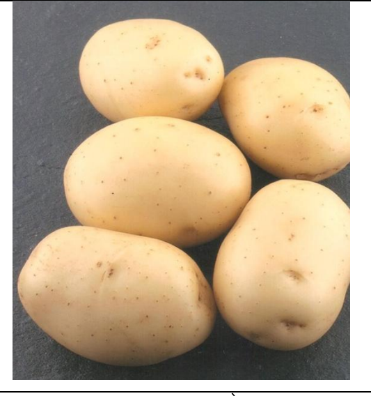
चित्र 05 : स्प्राउट का आकारः गोलाकार Figure 05: Light Sprout shape: Spherical