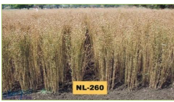
Figure 19: High 1000 grain weight चित्र 19: 1000 दानों का वजन: उच्च