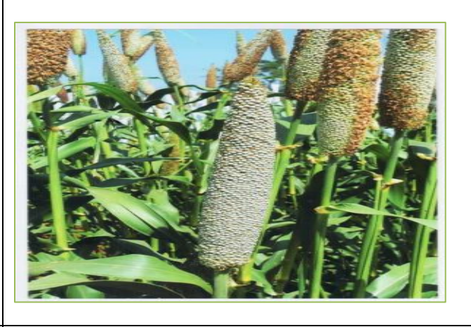
Figure 18: Conical spike shape; Compact spike density; Grey seed color चित्र 18 : शूक का घनत्व : कसा हुआ; बीज का रंग : धूसर

GV-2/ Little Millet ( Panicum miliare L.) जीवी—2/ छोटे अनाजों वाली फसल (पेनिकम मिलिएर एल.)