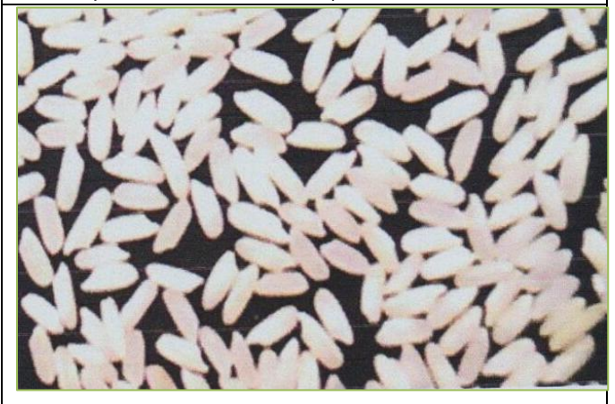
Figure 25: Short grain length चित्र 25: दाना: लंबाई: छोटा

Rice ( Oryza sativa L.) पीटीबी—58 (आईईटी—17608) (कल. 20 डी—1) चावल (ओराइजा सेटाइवा एल.)