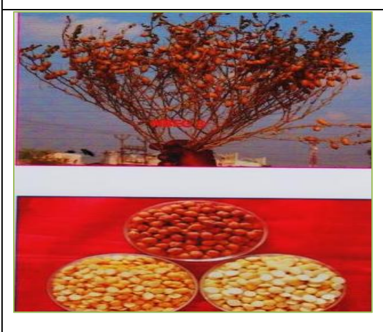
Figure 17: Medium pod size; Medium seed size चित्र 17: फली का आकार: मध्यम; बीज का आकार: मध्यम

Bio 70 (MH 1632)/ Pearl Millet ( Pennisetum glaucum (L.) R. Br. बायो 70 (एमएच 1632)/बाजरा (पैनिसेटुम गलुकम (एल.) आर. बीआर.